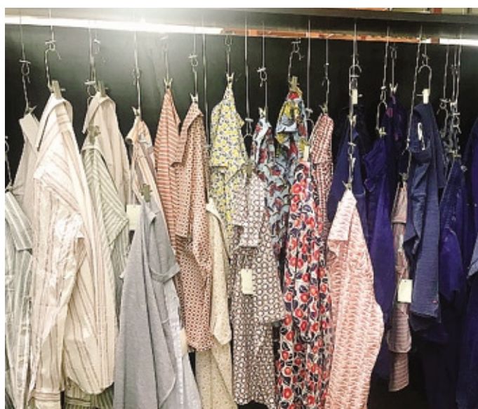
Alcuni prodotti by Canclini, a Milano Unica con diversi marchi