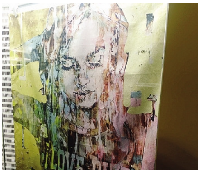
Il tessuto con l'opera di Marco Grassi